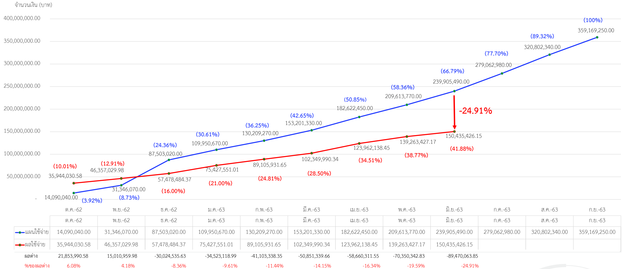
ผลการใช้จ่ายงบประมาณเงินรายได้ ประจำปีงบประมาณ พ.ศ. 2563 ณ ไตรมาส 3 (ตัดจ่ายจริงจากระบบ ERP)